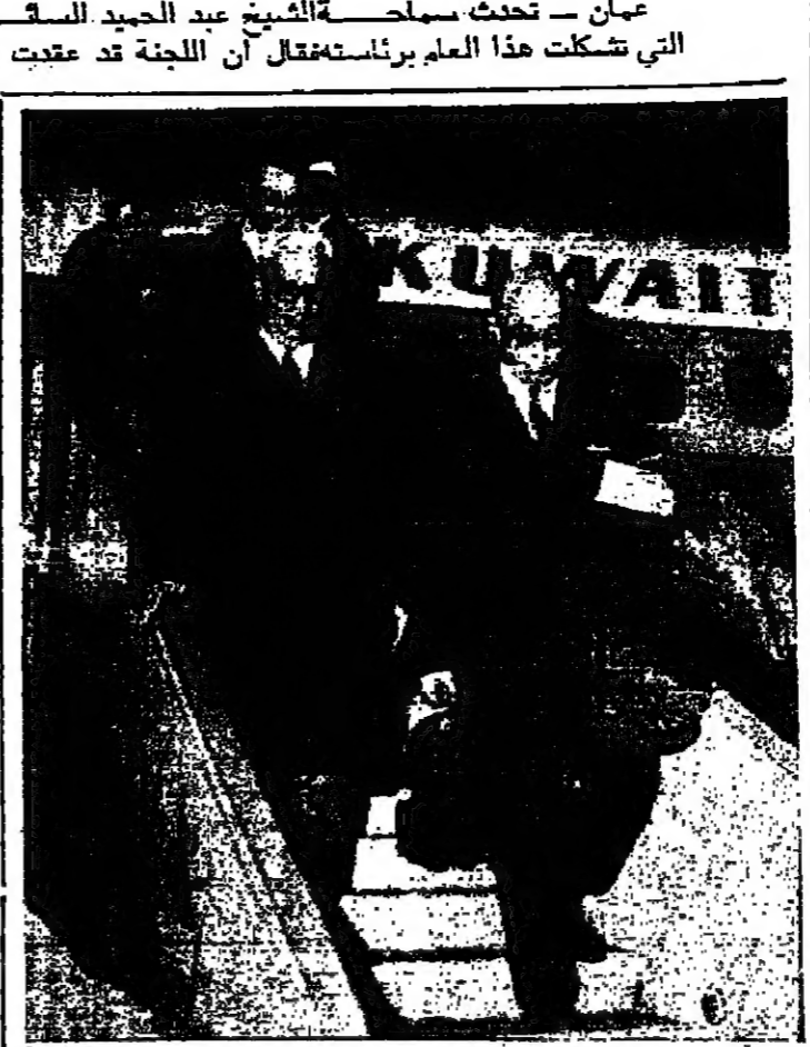
وزير القريبه الاردني والمصري ادي جويطها من الطائرة في مطار عمان أمس